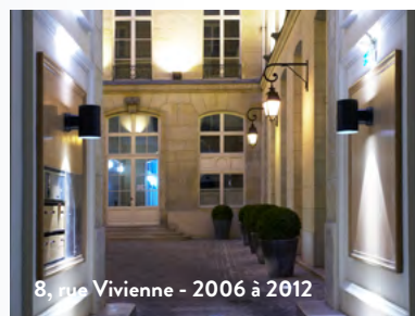
8, rue Vivienne - 2006 à 2012