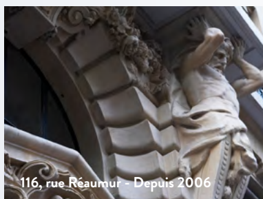
116, rue Réaumur - Depuis 2006