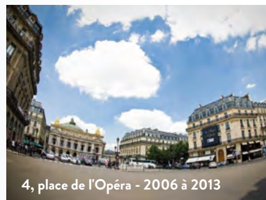
4, place de l'Opéra - 2006 à 2013