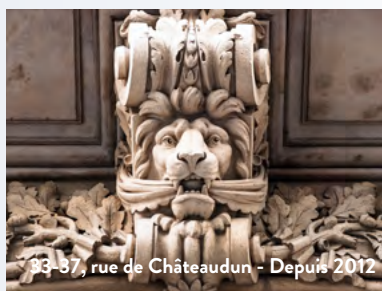
33-37, rue de Châteaudun - Depuis 2012