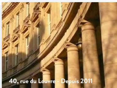
40, rue du Louvre - Depuis 2011