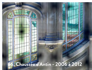
66, Chaussée d'Antin - 2006 à 2012